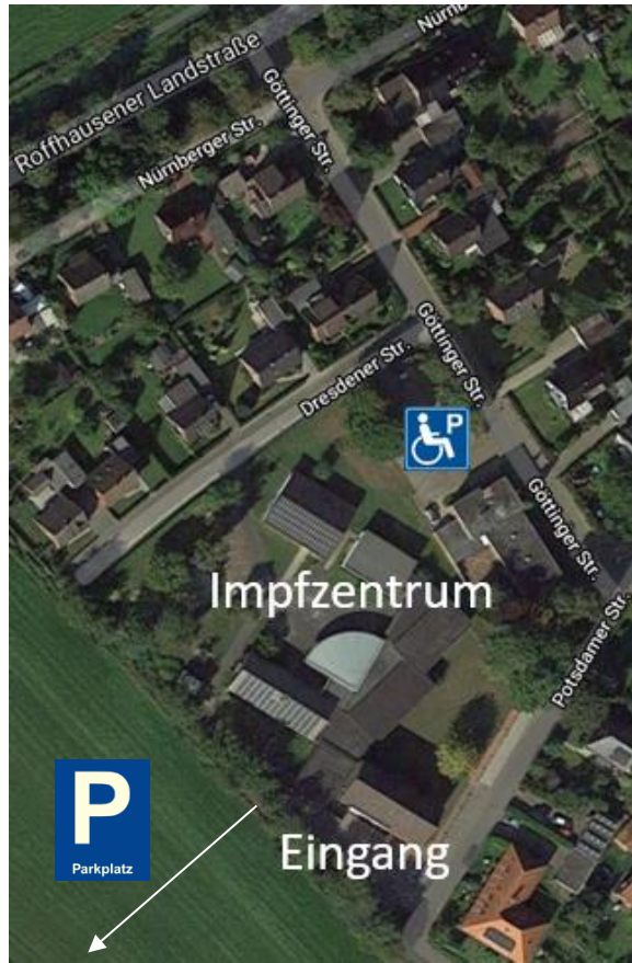
Ansicht mit Straßennamen