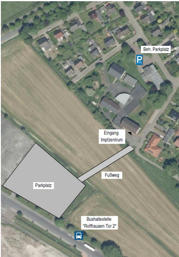
Ansicht mit Parkplatz