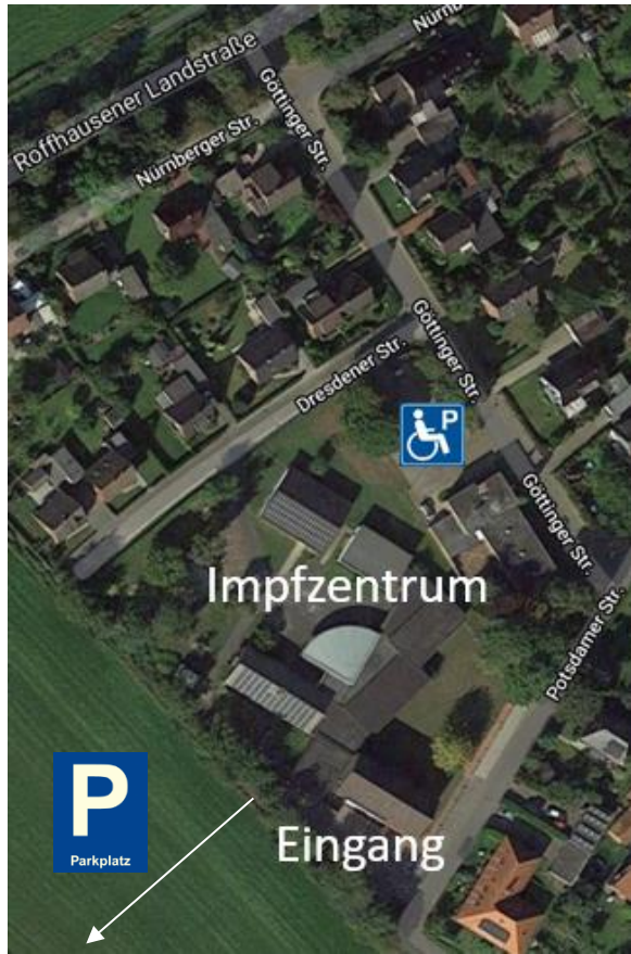
Ansicht mit Straßennamen